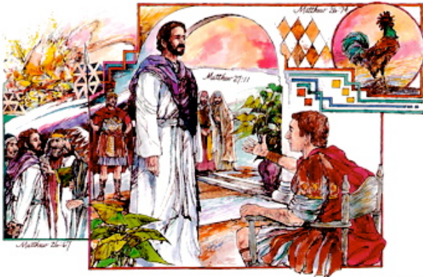
LESSON THREE - CHART 3