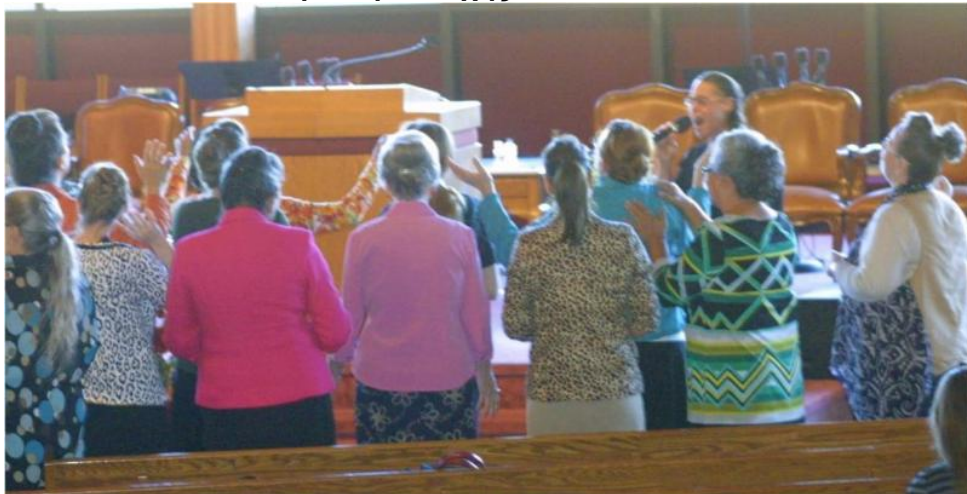
Προσευχόμενες για τα παιδιά μας