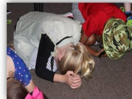
WNOP Kids Summit

hijos. En el reino de Dios, no hay límites para enlistarse. Aun los mismos jóvenes y niños son candidatos a unirse.